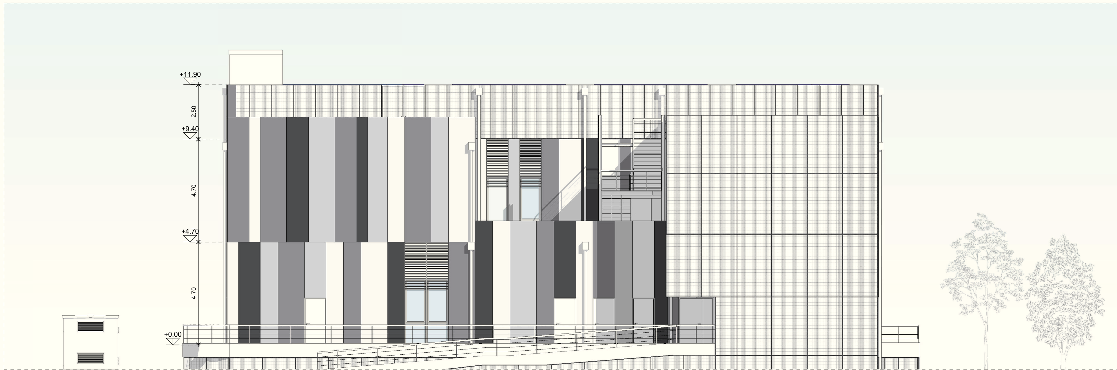
Prospetto Nord scala 1:100