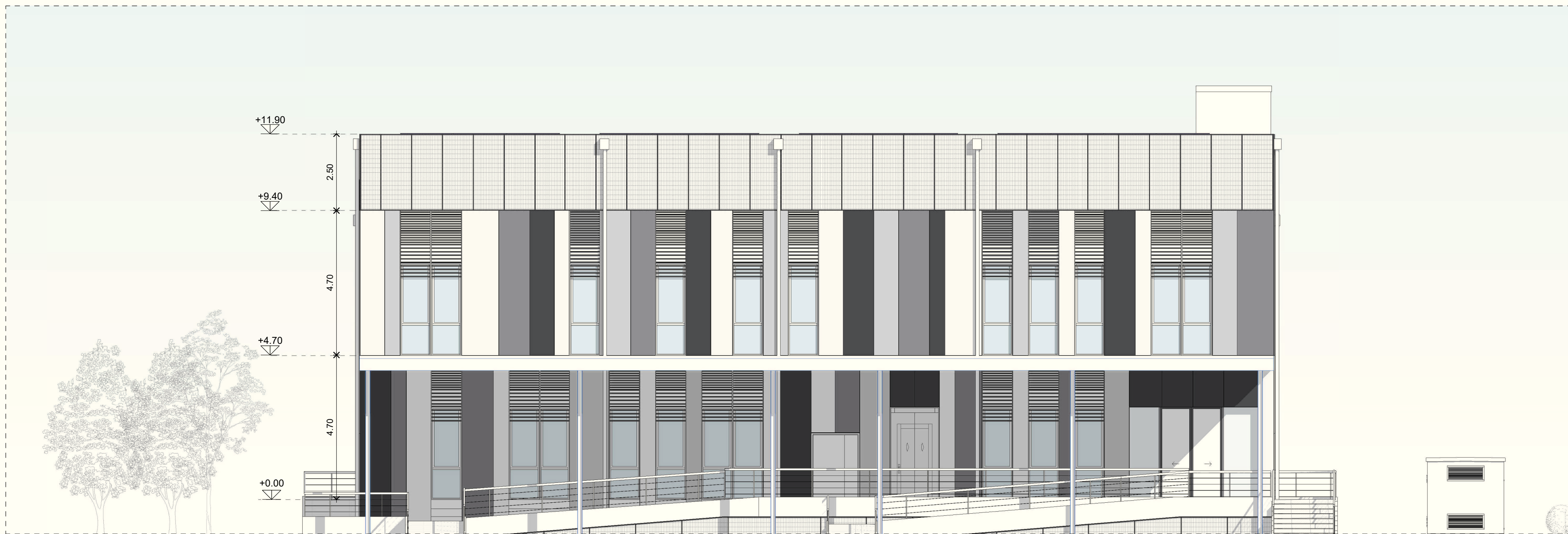
Prospetto Sud scala 1:100